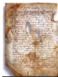
Псковская судная грамота

Двинская уставная грамота 1397 года. Мздоимство упоминается в русских летописях XIV века, например в Двинской уставной грамоте 1397 года в статье 6: «А самосуда четыре рубли, а самосуд то: кто изыснав татя с поличным, да отпустит, а себе посул возьмет, а наместники доведаются по заповеди, ино то самосуд, а опричь того самосуда нет». Там же, в статье 8: «...а черес поруку не ковати, а посула в железех не просити; а что в железех посул, то не в посул».