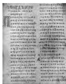
Двинская уставная грамота

Лихоимец – жадный вымогатель, взяточник».